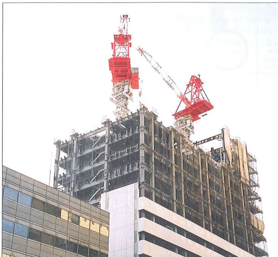
Mettre sur pied un projet d'infrastructure publique prend du temps et nécessite de répondre à diverses questions.

Guide romand pour les marchés publics: www.vd.ch/fr/themes/economie/marches.../guide-romand