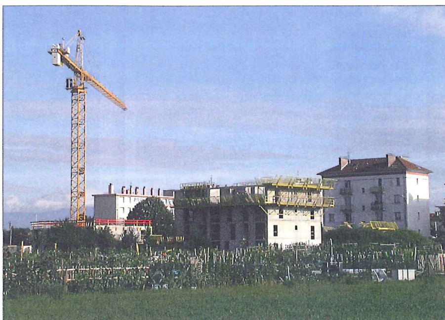
La procédure relevant de la police des constructions est un aspect déterminant.

Doivent par ailleurs être pris en compte les paramètres liés à la procédure relevant de la police des constructions, soit les délais inhérents à une mise à l'enquête, à d'éventuelles oppositions, voire au traitement d'un recours. La dernière phase, malheureusement pas toujours évitable, est la plus difficile à appréhender dans